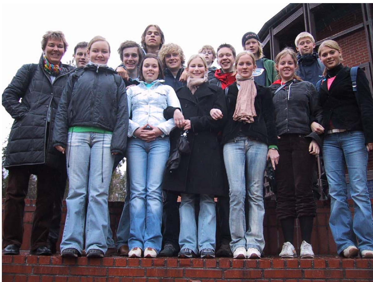
Haumyrheia elevråd på studietur i Oslo

Kurspakke for skoling av elevrådene i grunnskolen Utarbeidet av Pedagogisk senter, Kristiansand kommune Revidert august 2007